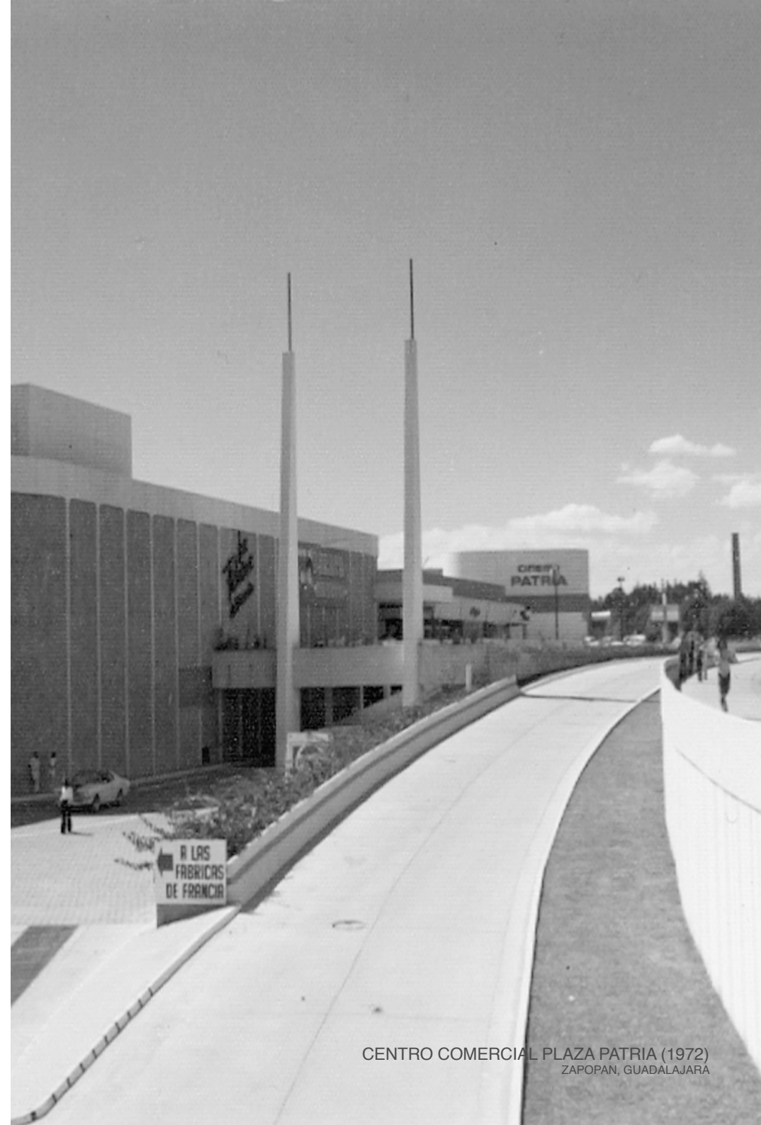
CENTRO COMERCIAL PLAZA PATRIA (1972) ZAPOPAN, GUADALAJARA

De igual manera, Ares ha sido desde sus inicios, líder en el campo del diseño interior de espacios comerciales tales como tiendas departamentales y tiendas de especialidad, trabajando con éxito con las principales marcas y llevando su trabajo a otros países y continentes.